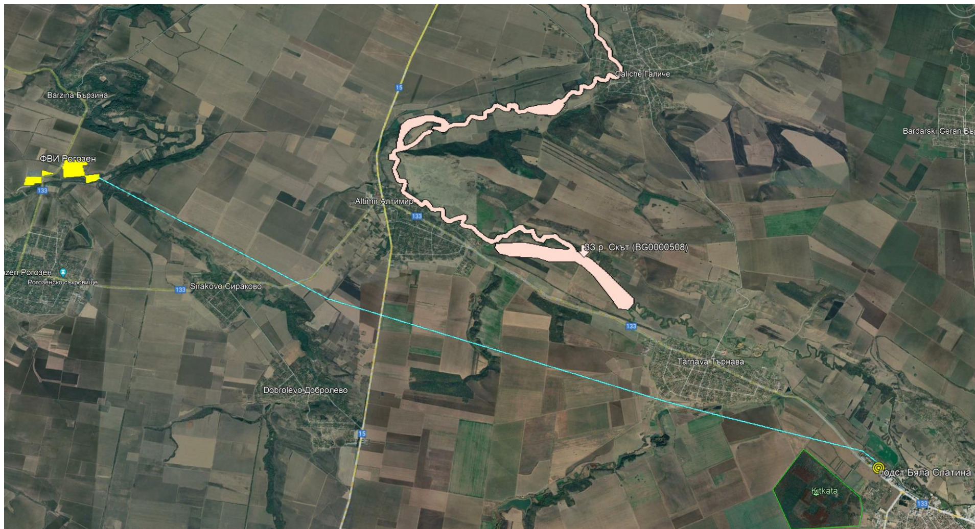
Фигура 1 Разположение на ИП